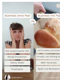
Pro & Contra Post

Hintergrund: Zwei Fotos Schriftfarbe: Rot Kontur & Rechtecke: Beige