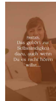
Reel Variante 2

Hintergrund: Foto Overlay: Rote Farbfläche Schriftfarbe: Beige Kontur: -