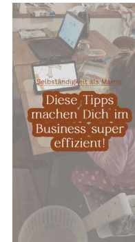
Reel Variante 1

Hintergrund: Foto Overlay: Beige Farbfläche Schriftfarbe: Beige Kontur: Rot